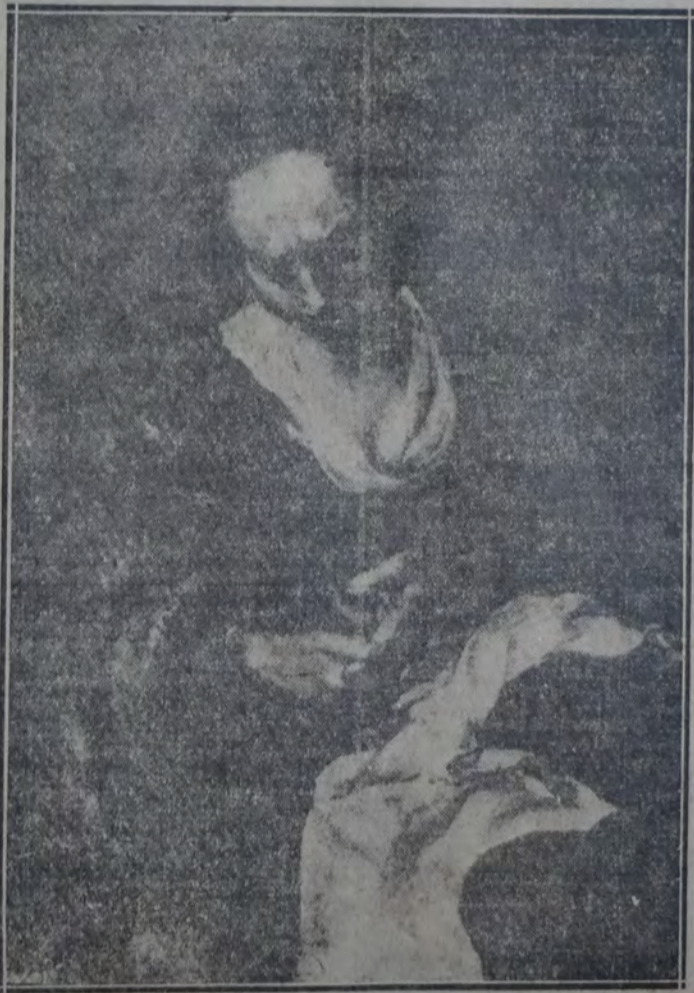
"LA COSTURERA", famoso cuadro de C. P. Berchem.